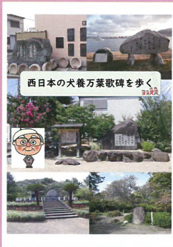
西日本編 全63ページ